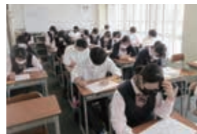
9月 | 前期単位認定試験