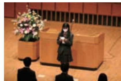
4月 | 入学式