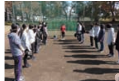
10月 | スポーツレク