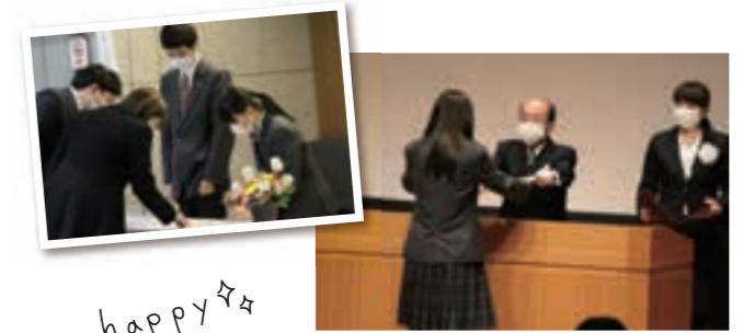
3月 | 卒業式