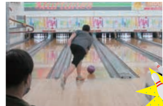
12月 | ボウリング大会