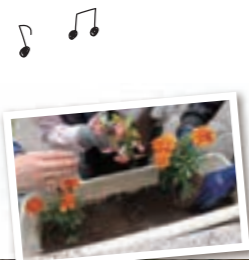
5月 | プランター作業