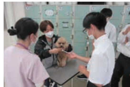
8月 | 技能連携