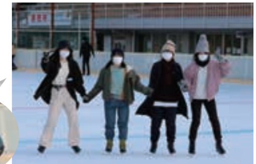
1月 | スケート教室