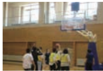
11月 | スポーツ大会