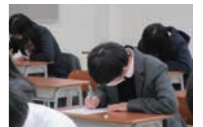
2月 | 後期単位認定試験