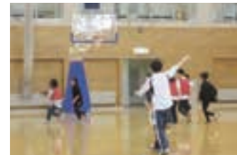
5月 | スポーツ大会